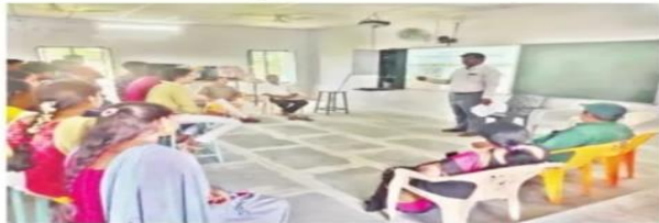
విద్యార్థులకు సేవ ప్రాజెక్టు పై అవగాహన చేస్తున్న అధ్యాపకుడు