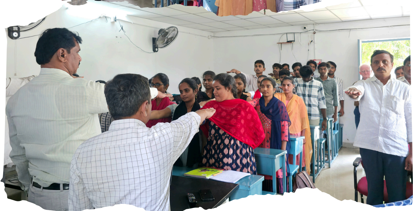
Students and Faculty are doing Pledge