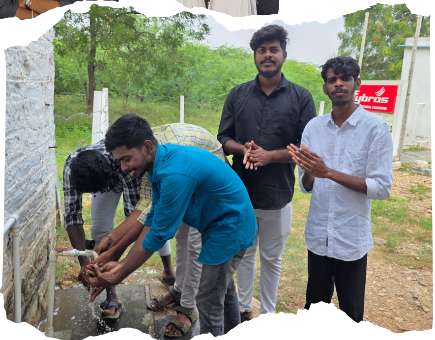
Hands on training on hand wash