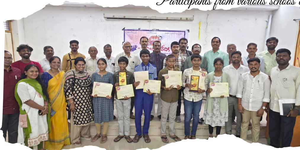
Distribution of Certificates to the winners