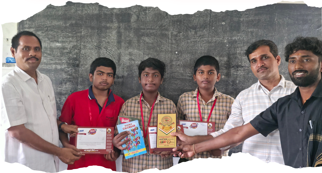
Mandal level Science Quiz competitions of jvv chekumuki science talent test on 4 th November, 2025