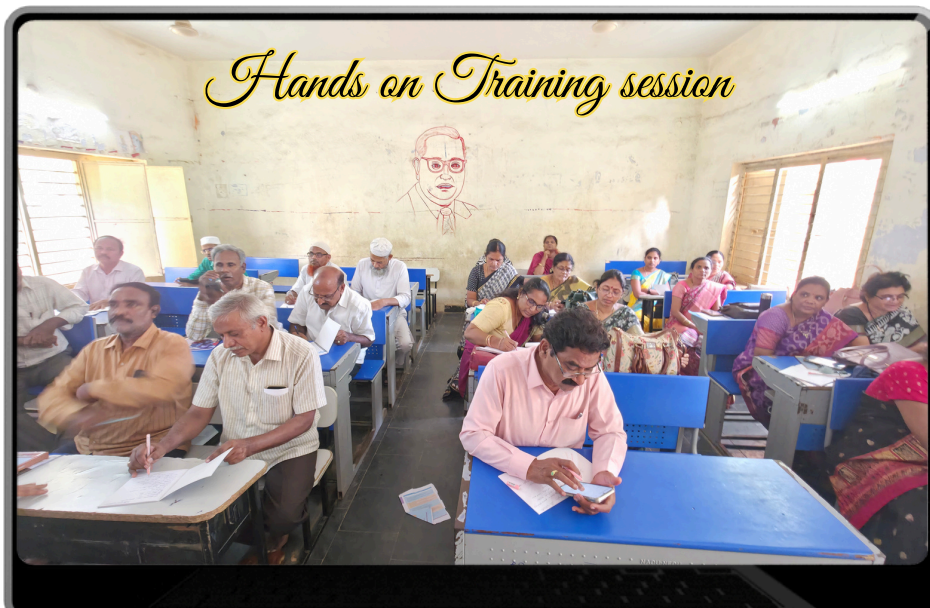
Hands on Training session