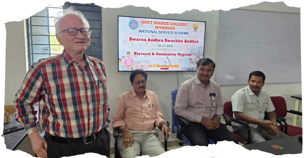
Conducted Awareness on Personal and Community Hygiene and