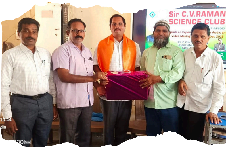
Felicitation to the resource person