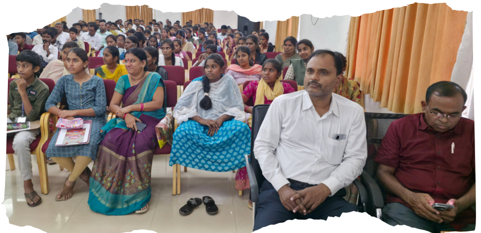
Participants from various schools of kadapa district