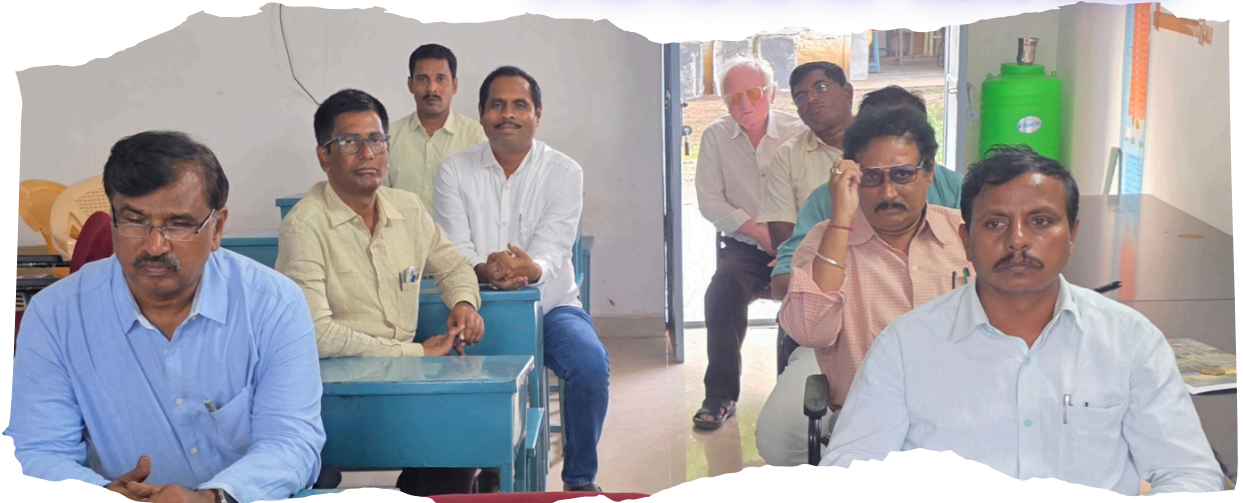
1st Sem Students and Faculty are being attended the webinar from day 1 to till end