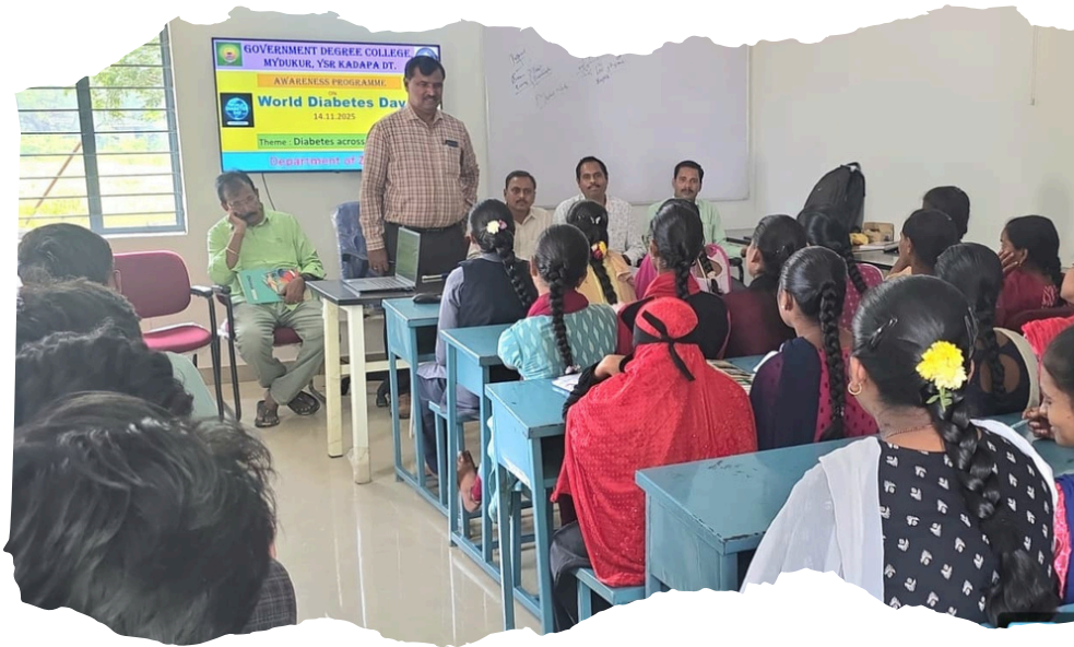
Department of Zoology organised World Diabetis Day on 14 th Novembr