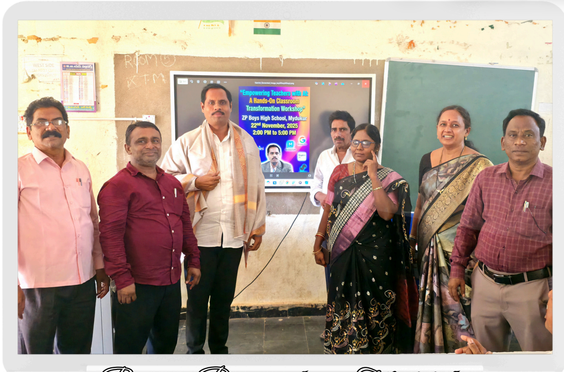
Resource Person is being Felicitated