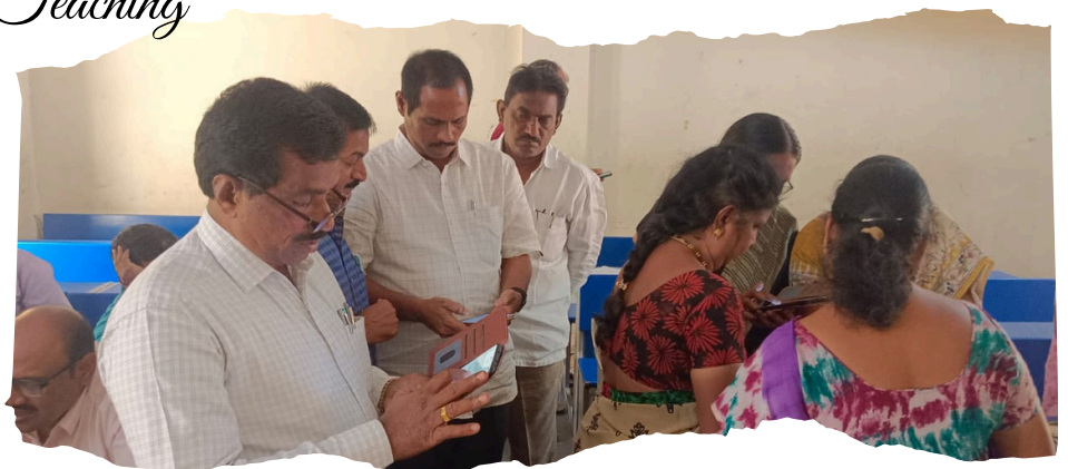
Hands on training with participants