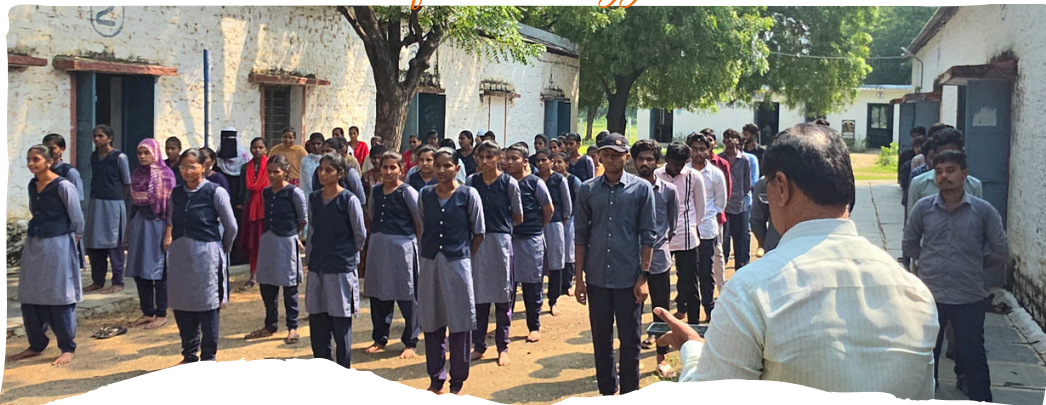
Students and Faculty are doing Pledge and mass singing of Vadae Mataram